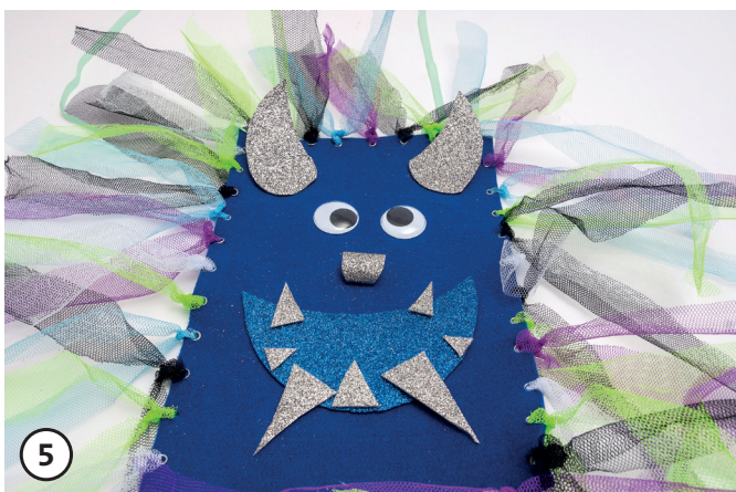
Maak het gezicht uit het glittervilt en plak de wiebelogen er op.