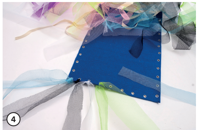
De stroken door de gaten halen en vastknopen.