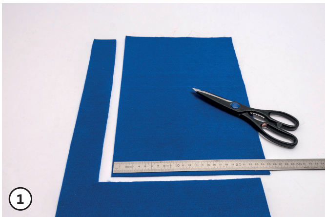
Knutselvilt afknippen op 36 x 24 cm.