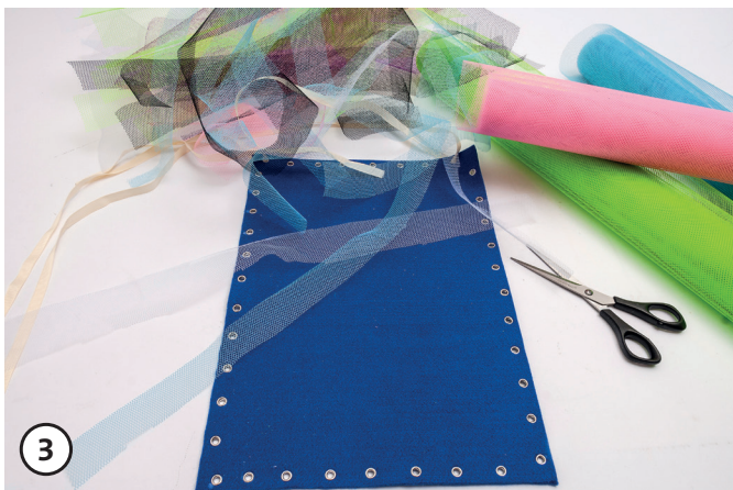
Tule stroken afknippen.