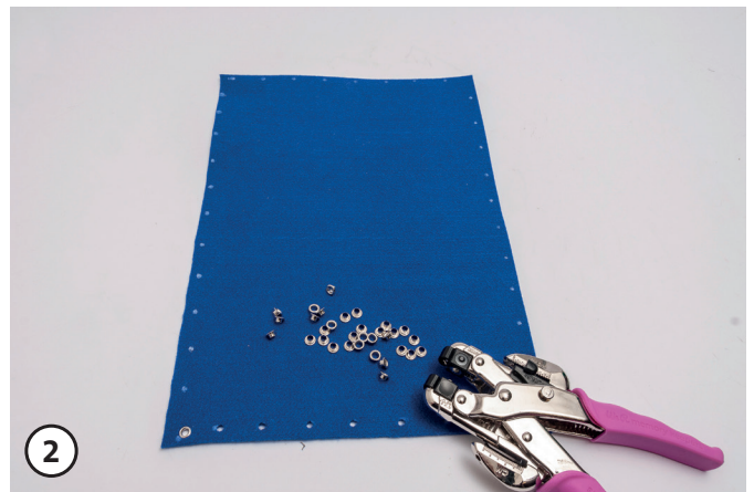
Gaten maken met een tussen afstand van ca. 1,2 cm.